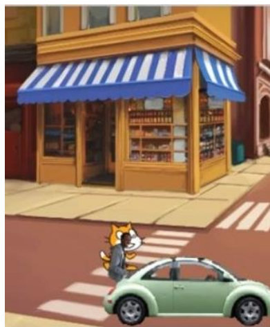
КОТ И ТАКСИСТ УРОК 4