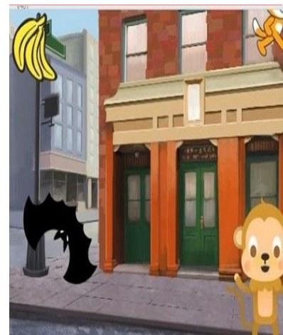
НАКОРМИ ПИТОМЦА УРОК 18

Работа в редакторе звука Блоки пера Циклическое рисование узоров