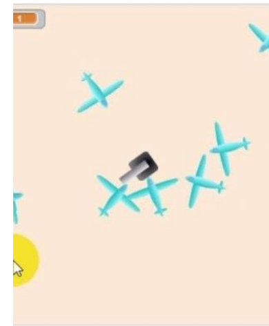
ПРОТИВОВОЗДУШНАЯ ОБОРОНА УРОК 31

Управление мышкой Касание спрайтов Блок изменения размера